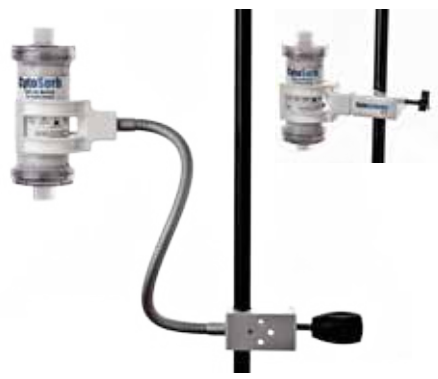
Halterung für CytoSorb