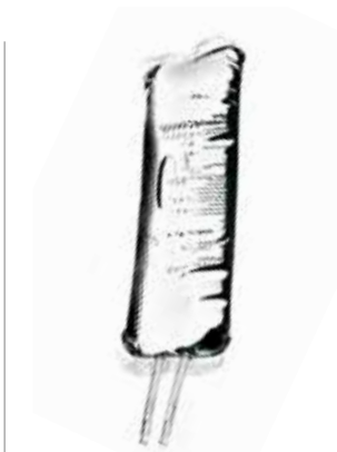
Isotonische Kochsalzlösung 2 Liter, steril