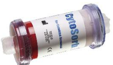
Abb. 1: CytoSorb® Zytokinadsorptionsfilter zur adjuvanten Sepsistherapie (mit freundlicher Genehmigung der Firma CytoSorbents Europe GmbH).

Neueste Therapieverfahren setzen bei der massiven inflammatorischen Zytokinfreisetzung in der Sepsis an, die als mögliche Ursache für die überschießende Antwort des Immunsystems angesehen wird. Die extracorporale Zytokinadsorption mittels Konzentrationsabhängiger, aber größenselektiver Filtration von Molekülen mittleren Molekü-